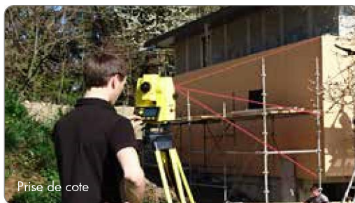
Prise de cote

Pour toute demande d'étude, des plans à l'échelle ainsi que les cas de chargement vous seront demandés.