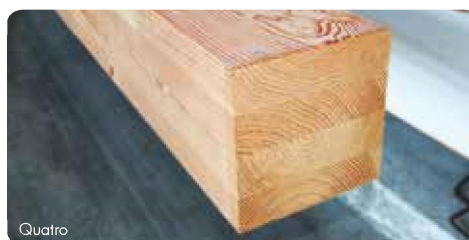
Construction duo, trio ou quatre selon sections et arrivages.